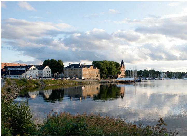
Hotell Blå Blom.